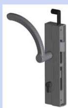
Serrure pour portillon avec fermeture automatique