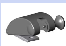
Système de fermeture manuelle